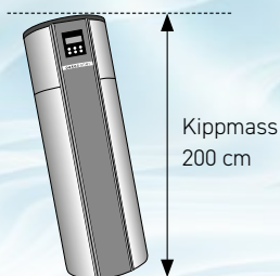
Kippmass 200 cm